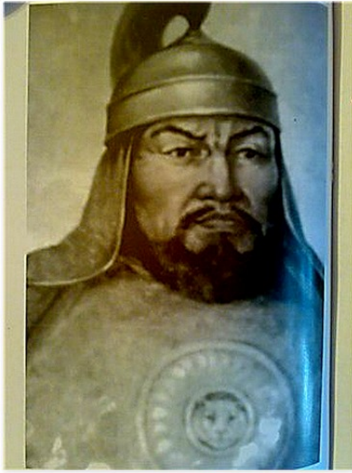
El batyr túrquico kazajo, Kabanbai (s. XVII). Nótese el pectoral con rostro de lince o lobo, muy parecido a los ibéricos (abajo).